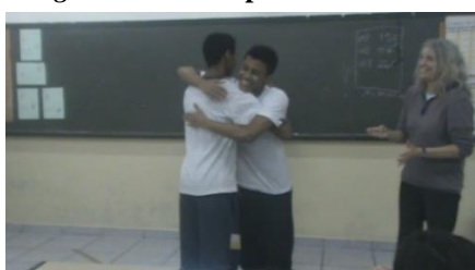
Figura 3. Recriando o Transtaruga